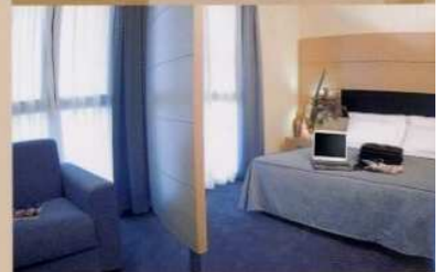
[ CH CONCORDIA HOTEL SAN POSSIDONIO/MO ]

Elegant is the selection of colours and chromatisms that raise Chagall's inspiration for Daphne and Cloe, perfect for an ambient that seems keeping the lines of Mediterranean Greek style.