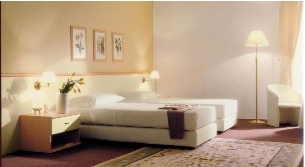
[ Mod. MANHATTAN ]