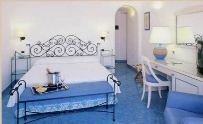
[ RELAIS MARESCA CAPRI ]